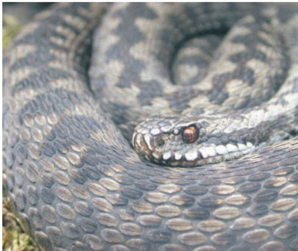
Huggormen är den enda giftiga ormen som finns i Sverige.