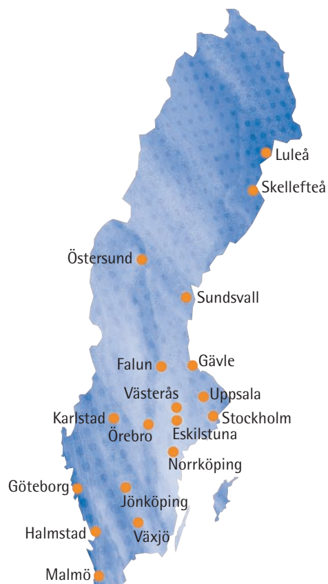
SOS-centralernas lokalisering i Sverige.

Tiden för att slå larm minskar genom mobilsamtalen. Å andra sidan ökar svårigheterna att lokalisera händelser, t ex trafikolyckor, eftersom den inringande ofta inte kan ange var han eller hon befinner sig. Positionering av GSM-telefoner vid nödsituationer har blivit ett viktigt hjälpmedel för att fastställa var en händelse har inträffat men med en ökande andel IP-telefoni följer samtidigt nya utmaningar i att koppla samman den nödställda med rätt lokala resurser.